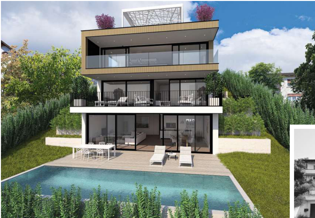
Links: Visualisierung eines möglichen Neubaus mit drei Wohnungen. Unten: So präsentierte sich das Objekt vor Beginn der Planungen.